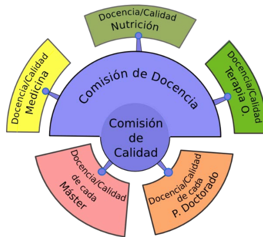
Figura 1. Estructura del Sistema de Garantía Interna de Calidad de la Facultad de Medicina

con carácter trimestral, de las que al menos dos de ellas serán presenciales. La Convocatoria se realiza con al menos 48 horas de antelación y en ella se incluye el orden del día previsto y la documentación correspondiente, siendo remitidos por medios electrónicos. Para la reunión en sesiones extraordinarias, se requiere la iniciativa del Presidente o la solicitud de un mínimo del 20% del total de miembros. La convocatoria de estas sesiones se realizará con una antelación mínima de 24 horas y contendrá el orden del día de la reunión. La toma de decisiones se lleva a cabo por asentimiento o, en su caso, por mayoría simple, quedando reservado el voto de calidad al Presidente. En caso de reunión electrónica, se consideran como asistentes al total de los miembros de la Comisión y la mayoría simple se considera sobre el conjunto de los mismos. Los acuerdos y decisiones adoptados por la Comisión de Calidad se elevan a la Junta de Facultad para su conocimiento y, en su caso, para su ratificación. Asimismo, se comunican a los interesados para realizar los cambios y mejoras oportunas.