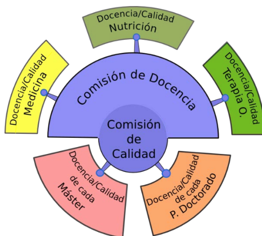
Figura 1. Estructura del Sistema de Garantía Interna de Calidad de la Facultad de Medicina

cabo por asentimiento o, en su caso, por mayoría simple, quedando reservado el voto de calidad al Presidente. En caso de reunión electrónica, se considera como asistentes al total de los miembros de la Comisión y la mayoría simple se considera sobre el conjunto de los mismos. Los acuerdos y decisiones adoptados por la Comisión de Calidad se elevan a la Junta de Facultad para su conocimiento y, en su caso, para su ratificación. Asimismo, se comunican a los interesados para realizar los cambios y mejoras oportunas.